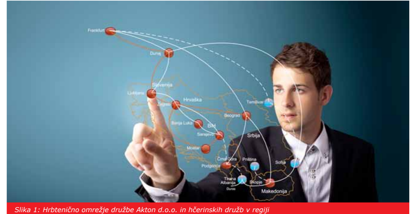
Slika 1: Hrbtenično omrežje družbe Akton d.o.o. in hčerinskih družb v regiji

(SLA - Service Level Agreement). Stranke lahko razporejajo pasovno širino med aplikacijami in protokoli, kot so VoIP, video konference, ERP, SIP, Citrix, X-Windows, PC-Anywhere, Netshow, Netbios, NFS, HTTP, dostop do Interneta, e-pošta in še veliko več.